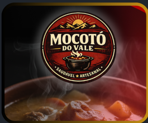
Criação de Logotipo